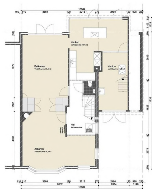
Begane Grond (Nieuw)